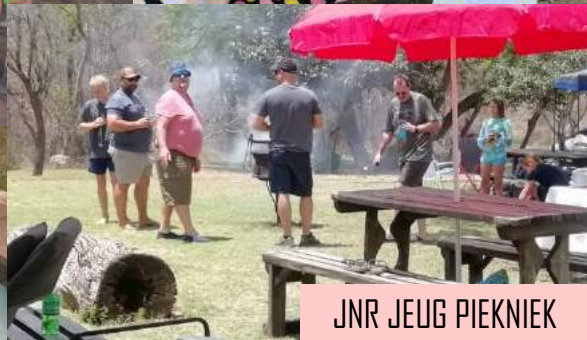
JNR JEUG PIEKNIK