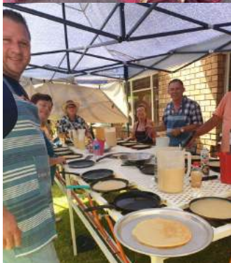
PANNEKOEKBAK BY DUETEHUIS BASAAR